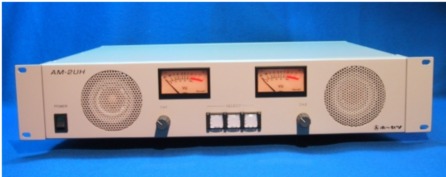
写真は3入力タイプ AM-2UH-3です。